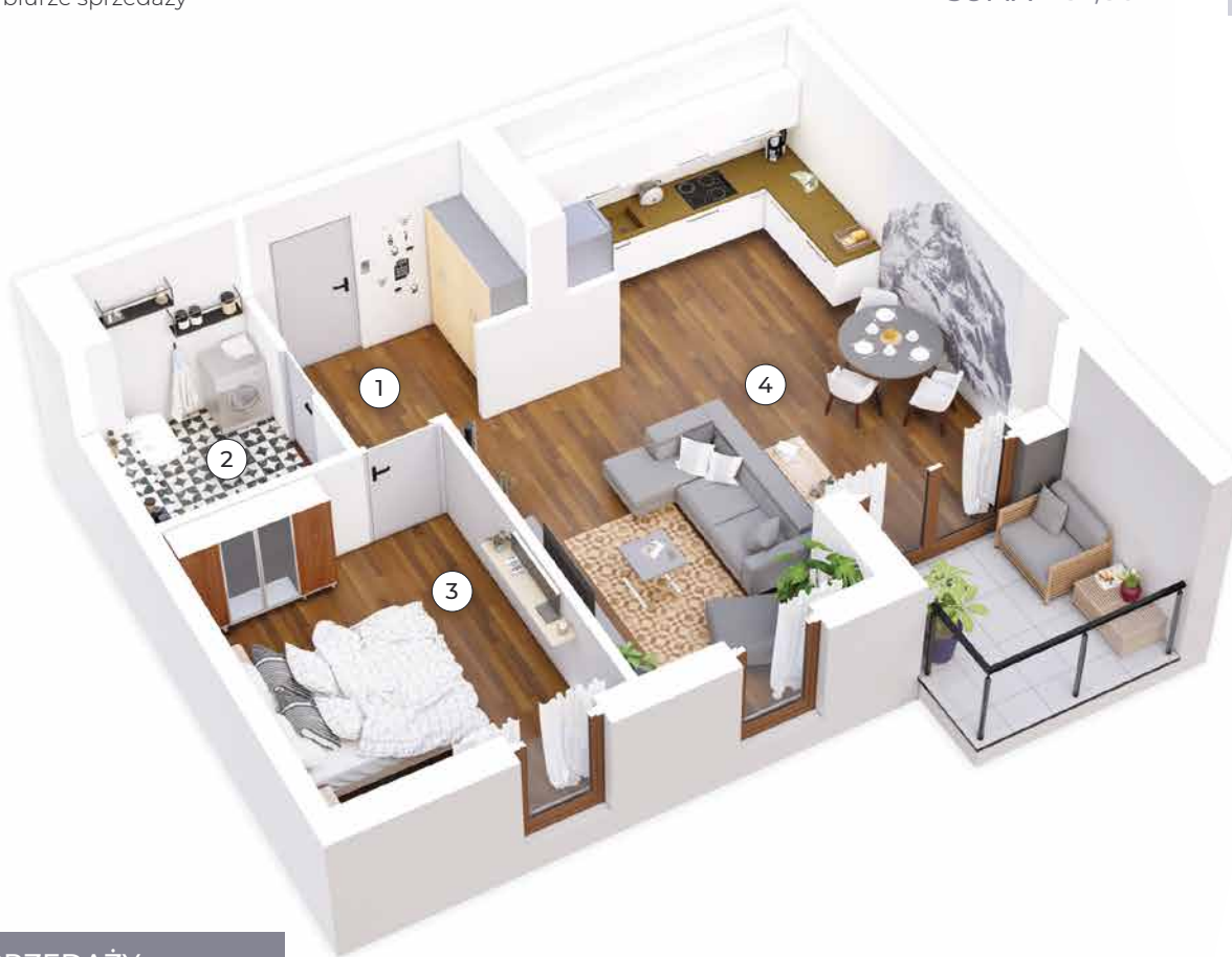
RZUT MIESZKANIA NR 15